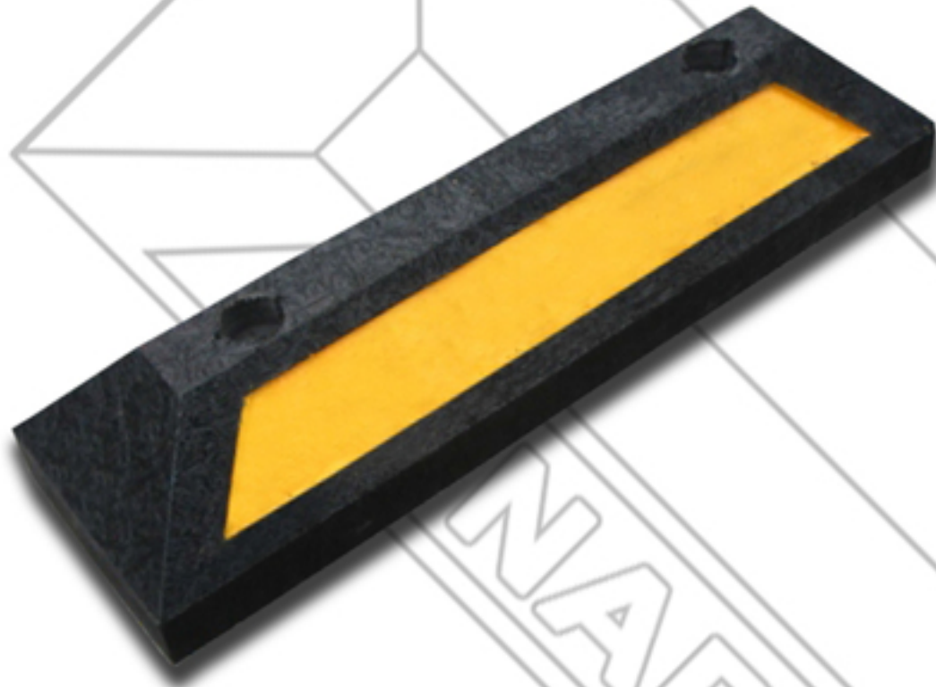
Sugerencia de instalación