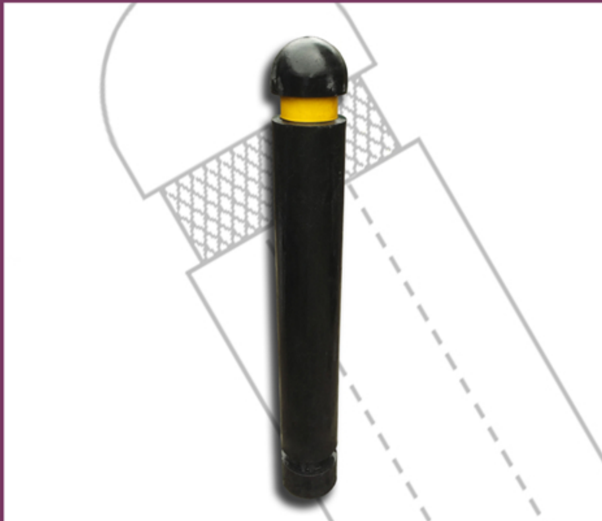
Sugerencia de instalación